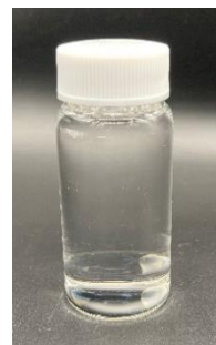
図 3 テリハボクおよびポンガミアの 種子から生成したニート SAF