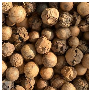
図 1 テリハボクの種子

国産 SAF を使用したフライトは沖縄県内路線では今回が初めてのこととなり、今後の沖縄県における循環型エネルギーの地産地消、および脱炭素社会への貢献が期待されます。