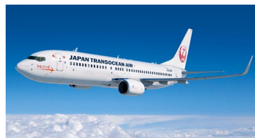
図4 当日使用予定の機材と同型機