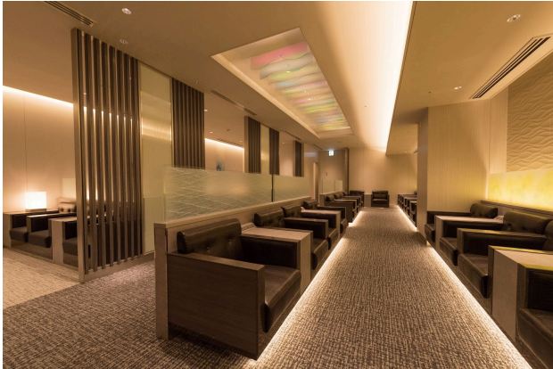
【那覇空港「ラウンジ琉輪」】

対象のステイタス会員のお客さま・プレミアムエコノミークラスご利用のお客さまは那覇空港では国際線ターミナル(出国後エリア4F)の「ラウンジ琉輪」を、台北(桃園)空港では第2ターミナル(出国後エリア4F)のチャイナエアライン ラウンジ「梅苑」をご利用いただけます。ご出発前のひとときをゆっくりとお過ごしください。